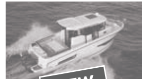
Merry Fisher 875 marlin offshore