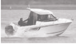
Merry Fisher 605